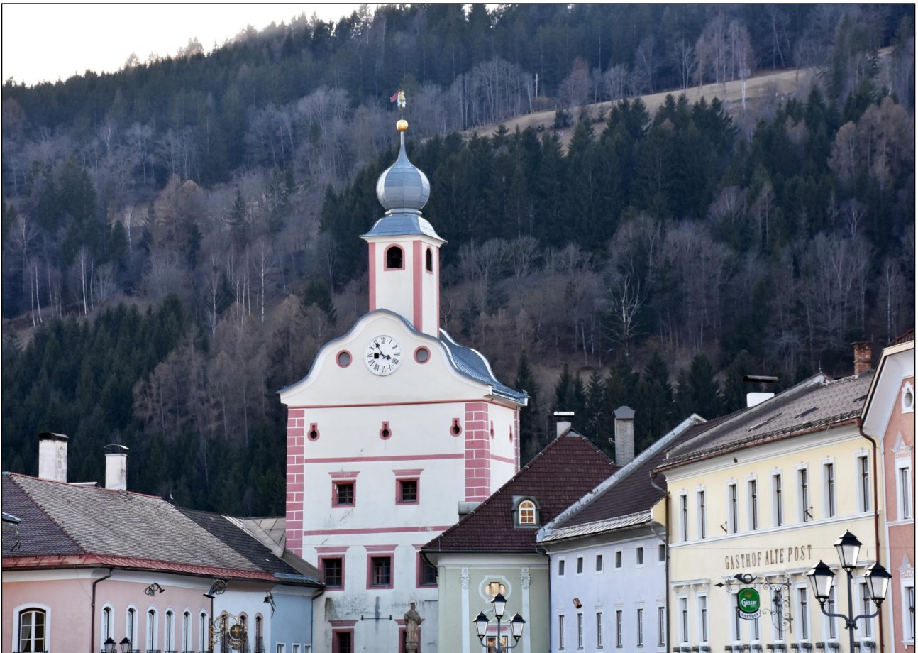
Gmünd in Kärnten, Blick vom Hauptplatz zum Unteren Tor.