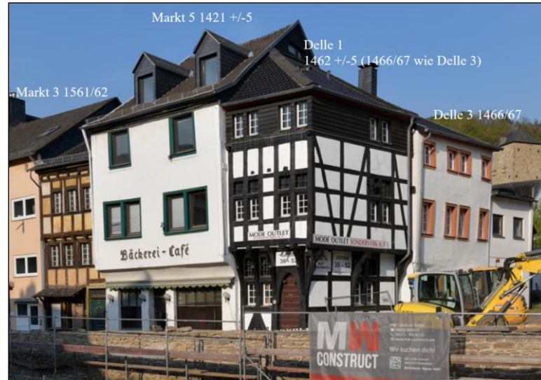
Bad Münstereifel, Dendrodatierte Häuser, von links: Markt 3, 1561/62, Markt 5, 1421 +/-5, Delle 1, 1462 +/- 5, Delle 3, 1466/67 (d).

Die überwiegende Anzahl der Fachwerkgerüste in Bad Münstereifel sind giebelständig zur Straße orientiert. Traufständige Gebäude mit einer entsprechenden Erschließung treten dagegen zahlenmäßig deutlich zurück. Ein Beispiel dafür ist das auf 1650/51 (d) datierte Fachwerkgerüst Heisterbacher Straße 3. Das Gebäude wurde im Inneren mehrfach umgebaut und auch eine Flurwand im Erdgeschoss versetzt. Das Dach wurde 1844/45 (d) in Stand gesetzt, wobei