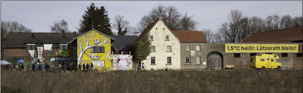
Lützerath nach den ersten Abbrüchen und geprägt durch das Klimacamp im Februar 2022. Der Duissener Hof (rechts) ist noch bewohnt und bewirtschaftet.

zogene Dörfer mit entwidmeten Kirchenbauten. Die Immobilien und Flächen gehören mit wenigen Ausnahmen dem Braunkohle- und Energiekonzern RWE. Erstmals in der Geschichte des Rheinischen Reviers müssen über Jahre leerstehende und vernachlässigte Gebäude, Baudenkmale und dörfliche Strukturen einer neuen Nutzung zugeführt werden – die Dörfer „revitalisiert“ werden. Es wird zu beobachten sein, welche Akteur*innen und Interessenslagen sich hier durchsetzen und wie sich partizipative Prozesse abbilden werden.