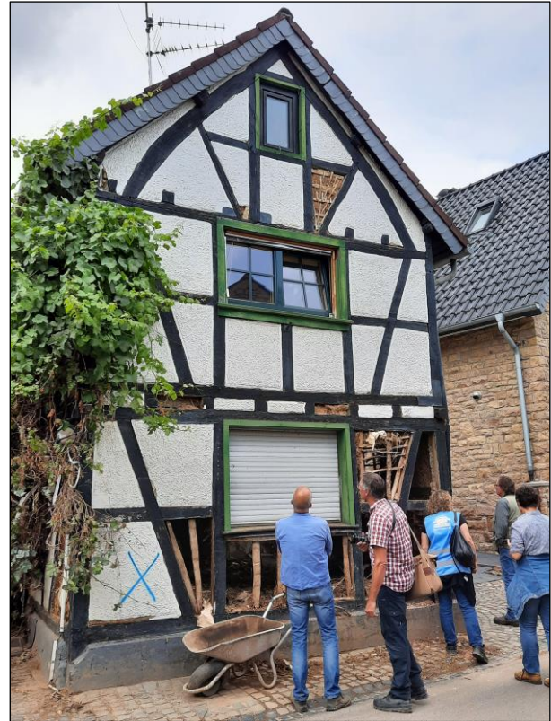
IgB-Mitglieder in Iversheim mit Mitarbeiterinnen des Bauamts von Bad Münstereifel.

Bei allen von der IgB besichtigten Objekten erschien nach der Sichtprüfung ein Abriss nicht notwendig. Es kann außerdem festgehalten werden, dass der Gebäudebestand im Kern vielfach